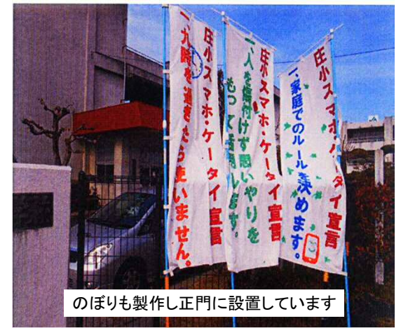
のぼりも製作し正門に設置しています