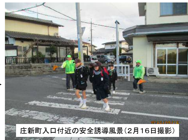
庄新町入口付近の安全誘導風景(2月16日撮影)

1年を終えるにあたり、子どもたちが感謝の気持ちを伝える「感謝の会」が2月末頃、また新学期が始まりますと安全パトロールの方と子どもたちとの「対面式」が、5月頃庄小学校で開催を予定されています。 さらに、今年はより一層の安全、安心を目指して”庄小学校””川崎医療福祉大学の学生ボランティ