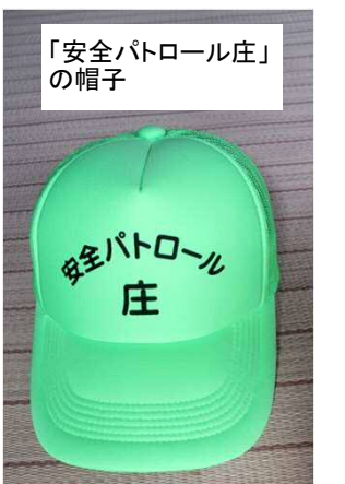
「安全パトロール庄」の帽子

安全パトロール活動中に長年着用している緑のチョッキとともに身につけて、児童の登下校時に付き添って歩いたり通学路の危険と思われる箇所様子を見守って下さるだけで安心して通学できます。交通安全はもちろん防犯効果も期待できます。