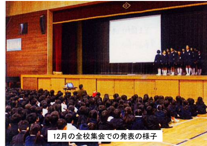
12月の全校集会での発表の様子