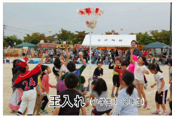
玉入れ (小学生1・2年生)