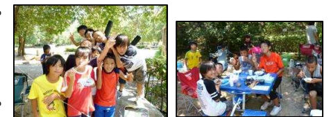
バーベキューもやっちゃいます♪